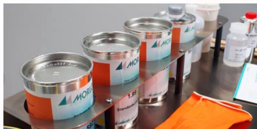
Rack pour les encres et les aditifs auxiliaires

Optimisé pour les utilisateurs de machine d'impression, le nouveau MW700 2.0 est équipé d'étagères pour stocker les produits auxiliaires, tampons, des outils et plus encore. Pour les travaux de nettoyage, un support de serviette de papier est également intégré.